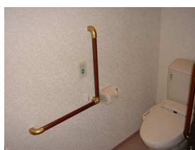
▲居室内専用トイレ